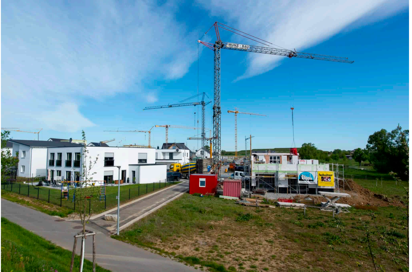
Inflation und steigende Grundstückspreise: Wie lässt sich der Traum vom eigenen Zuhause kostengünstig umsetzen?