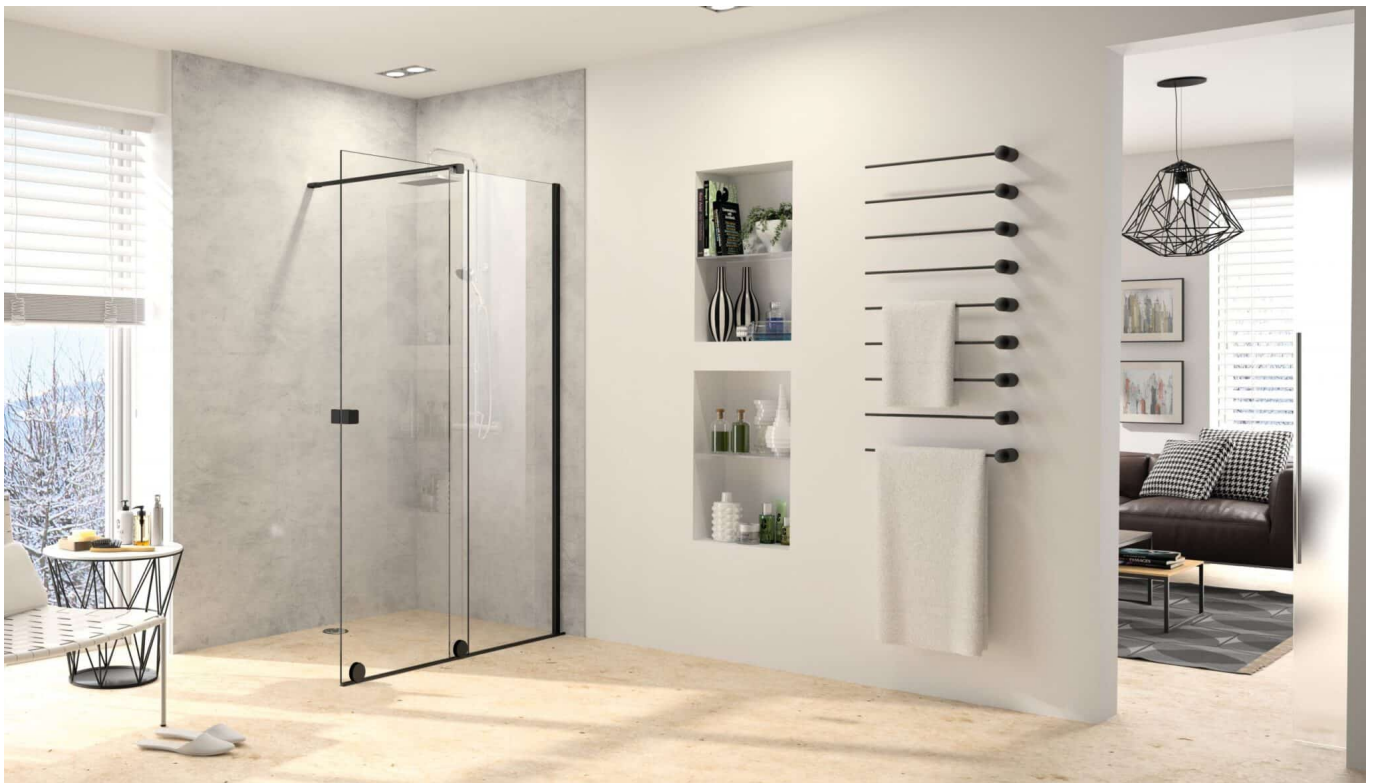
Ebenerdige Dusche, Treppenlift oder eine Rampe - bauliche Maßnahmen für ein barrierefreies Zuhause werden staatlich gefördert.

„Verstärkt wird dies durch eine allgemeine krisentypische Verunsicherung, die besonders bei jungen Familien eine gewisse Zurückhaltung zur Folge hat. Dennoch dürfe ein Faktor nicht unberücksichtigt gelassen werden. Schließlich lief Ende März 2021 das Baukindergeld aus, das noch von vielen Familien „mitgenommen“ wurde - dies puschte die Baugenehmigungen im ersten Quartal 2021 spürbar“, konstatiert VQC-Vorstand Püttcher.