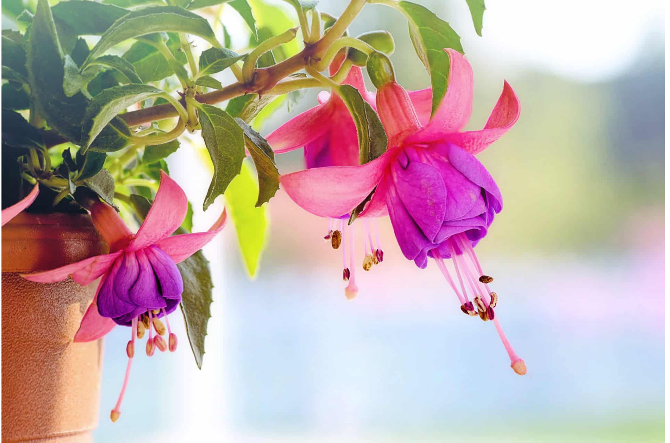
Symbol-Foto von Jill Wellington