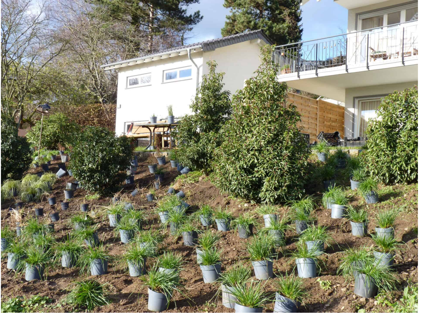
Die Pflanzzeit für Gräser beginnt jetzt, am besten in feuchten Boden.