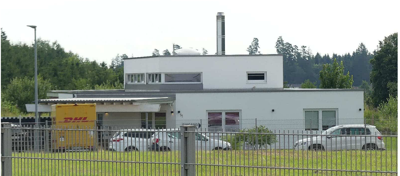
Das bestehende Tierkrematorium bleibt allein am Hirtenwald.

Dennoch hat im Juli 2014 der Gemeinderat beschlossen einen Bebauungsplan Sondergebiet Krematorium Hirtenwald aufstellen zu lassen. Das übliche Verfahren rollte an, die Anhörungen der Behörden liefen. Im Herbst 2017 ergab sich dann, dass im Bebauungsplan Waldabstandsregeln eingehalten werden müssen.