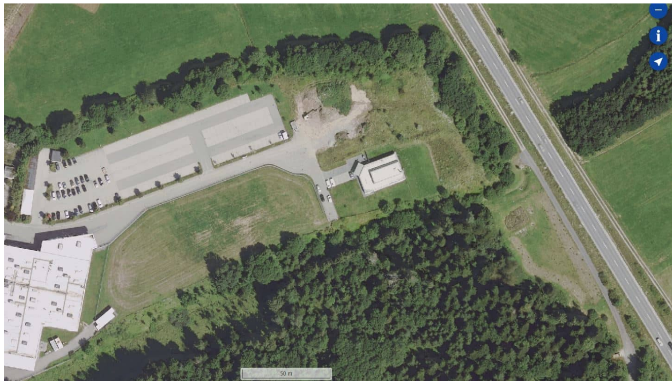
Der Waldabstand würde nicht eingehalten.