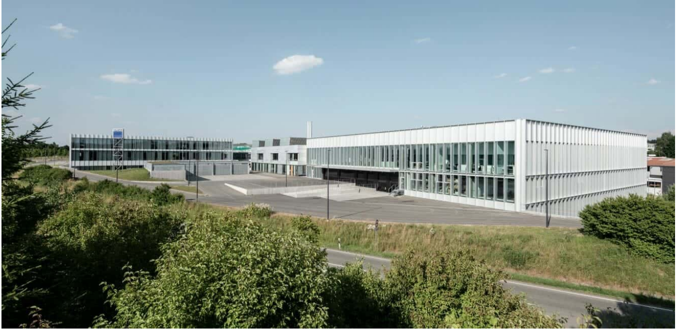
Trumpf Laser in Sulgen.