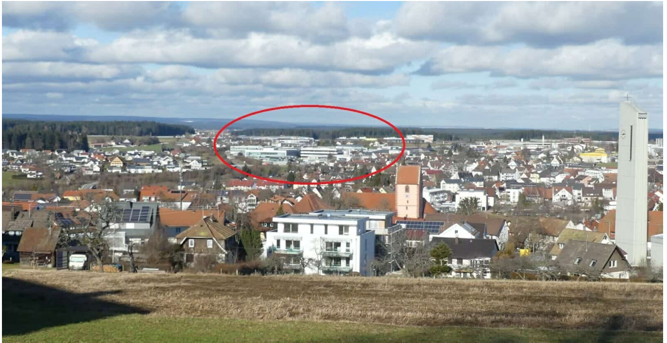
Trumpf Laser heute: gesehen vom Schönblick in Sulgen aus.