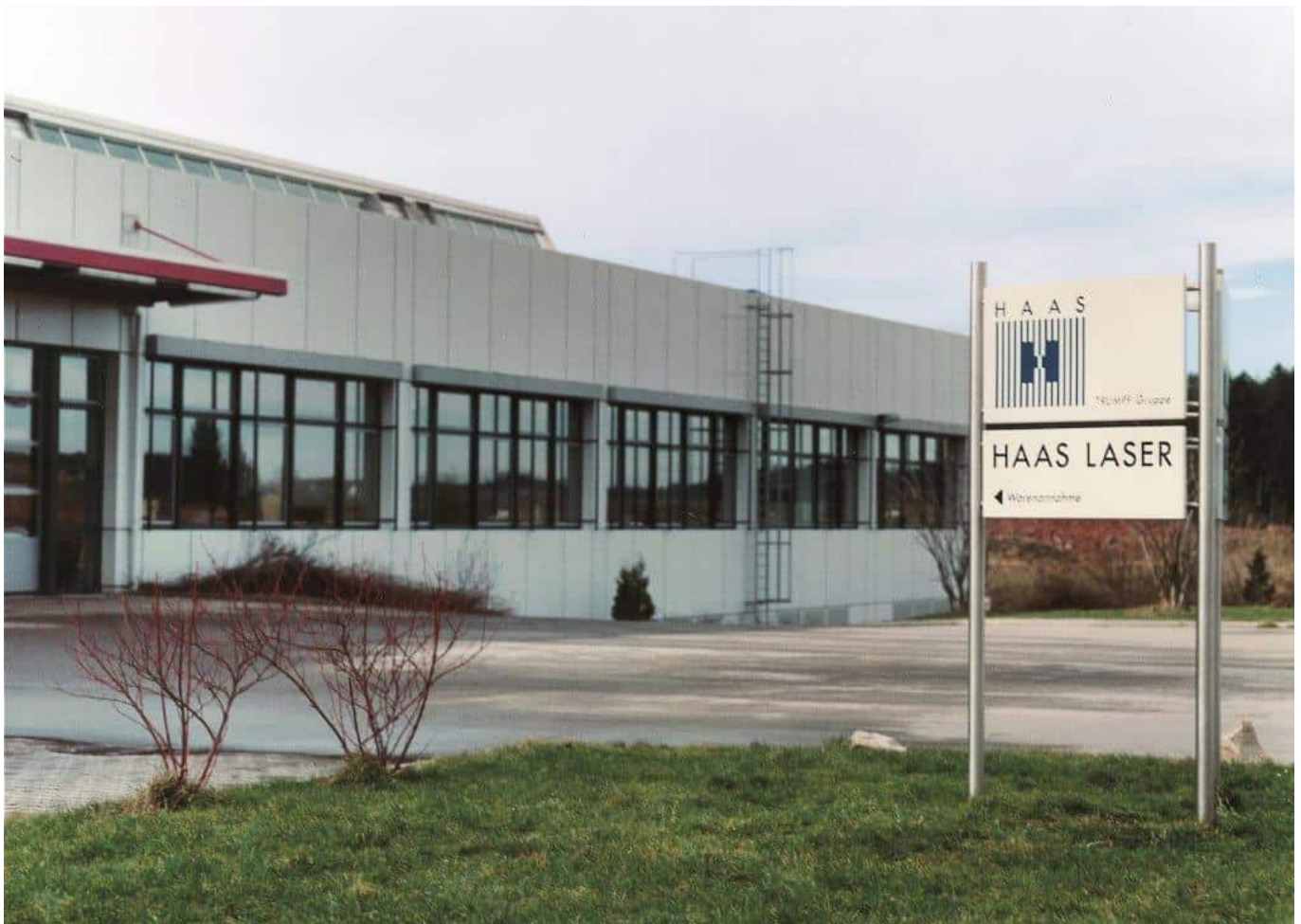
Umzug auf den Sulgen.