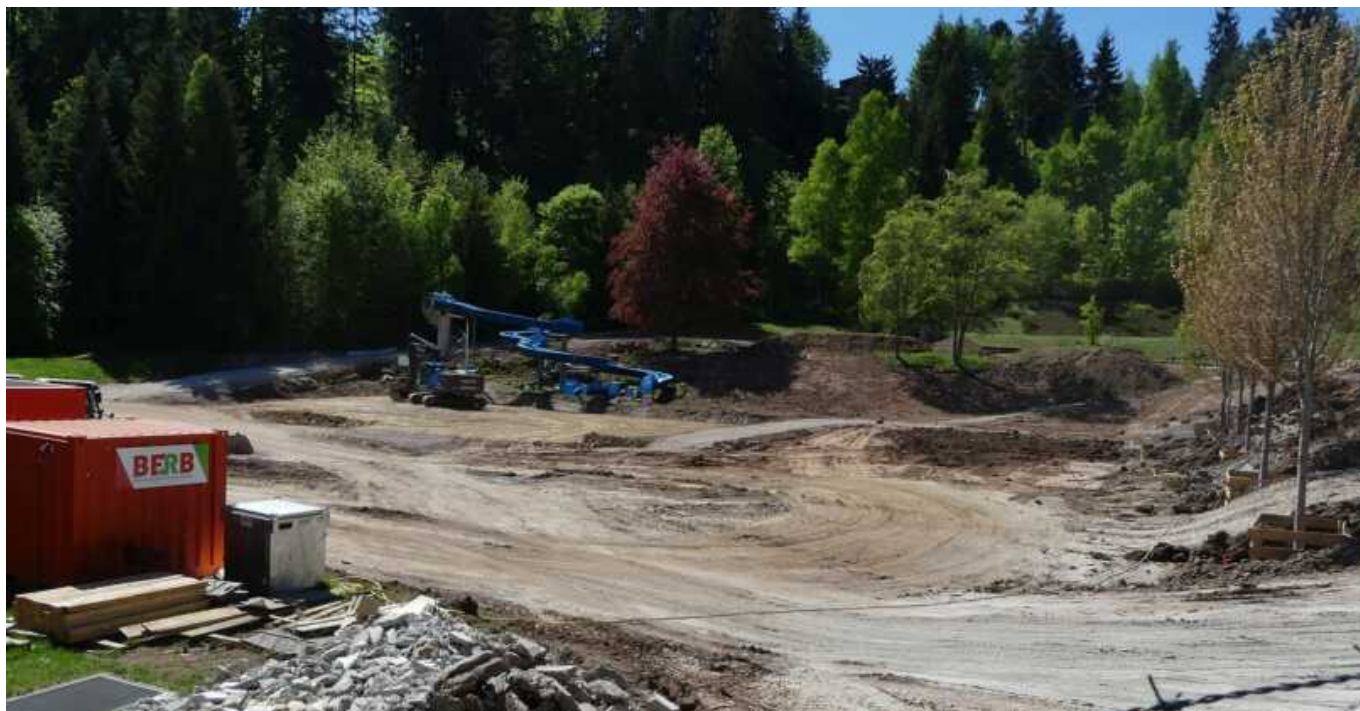
Die Rutsche ist teilweise demontiert.