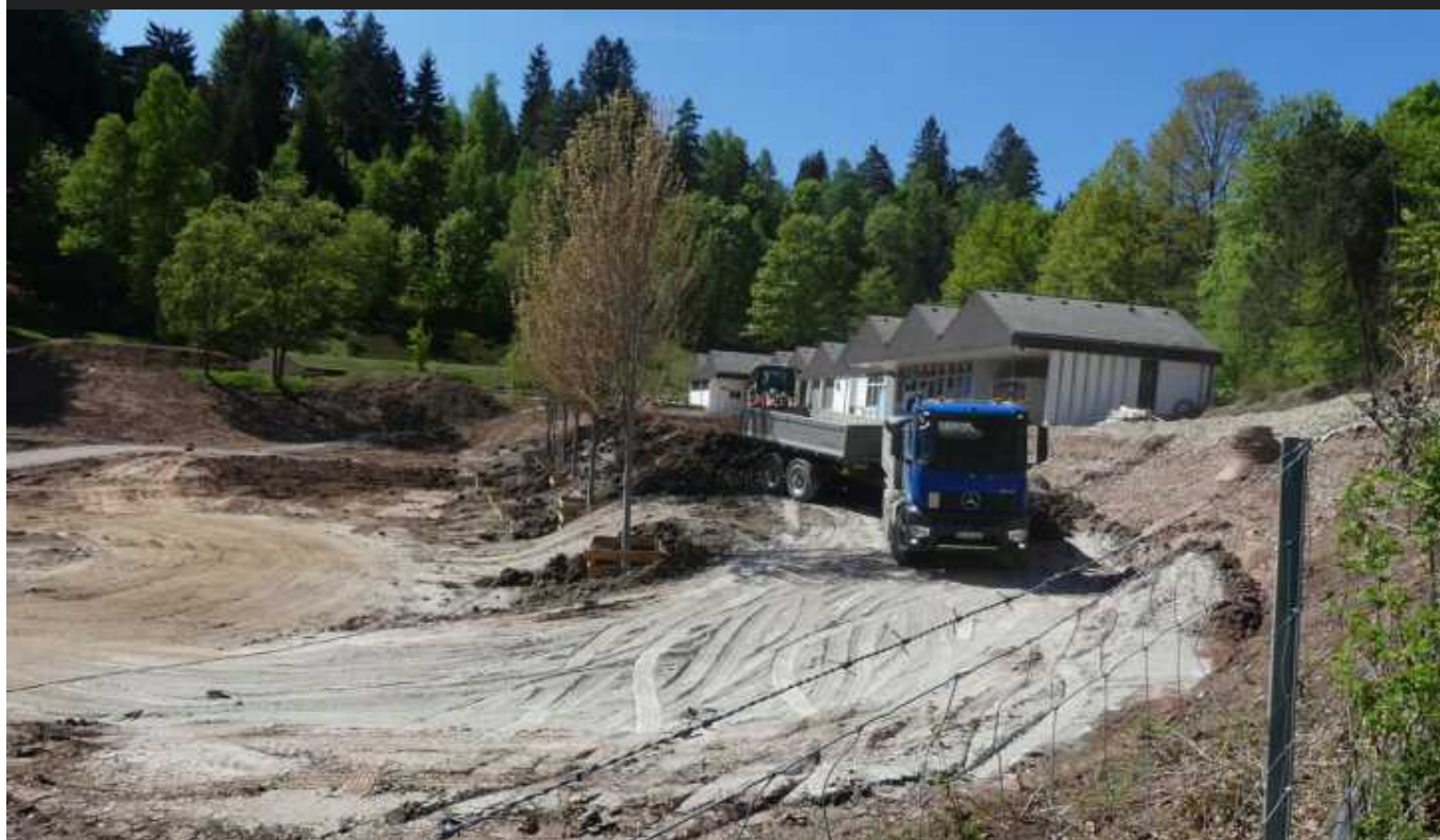
Auch die Terrassenstufen werden wieder entstehen.