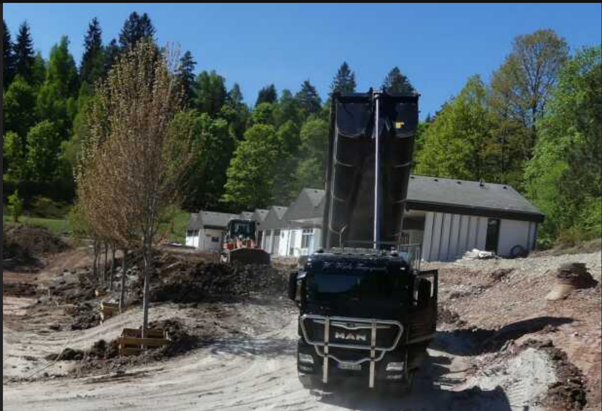
Schwere LKWs auf der Baustelle