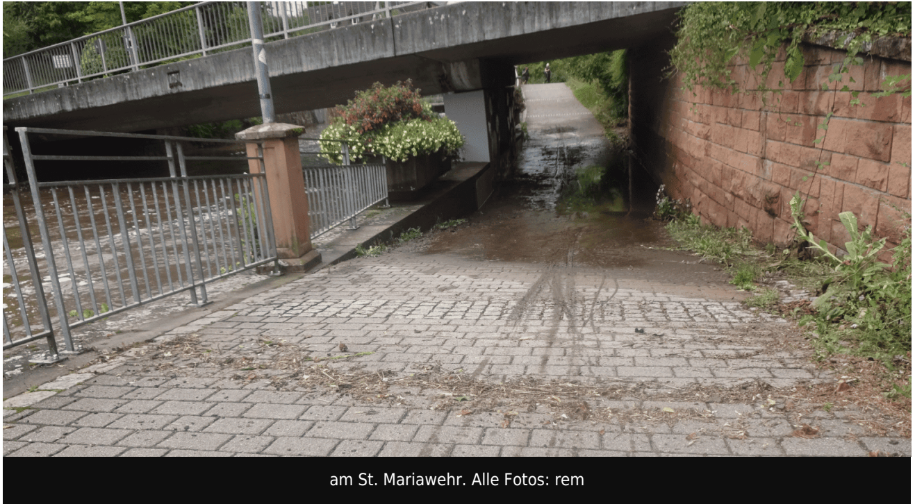
am St. Mariawehr.