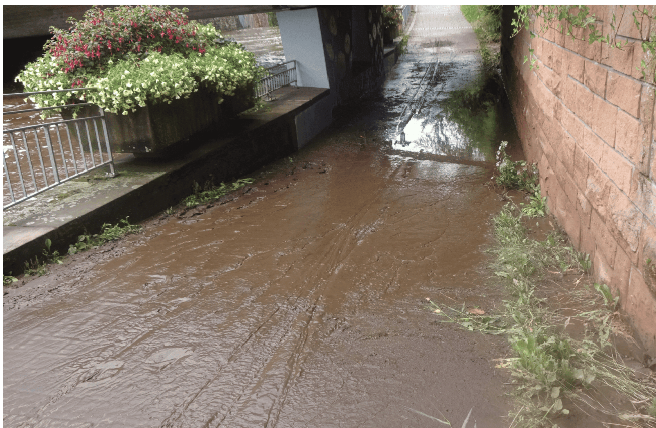
bis zur Unterführung