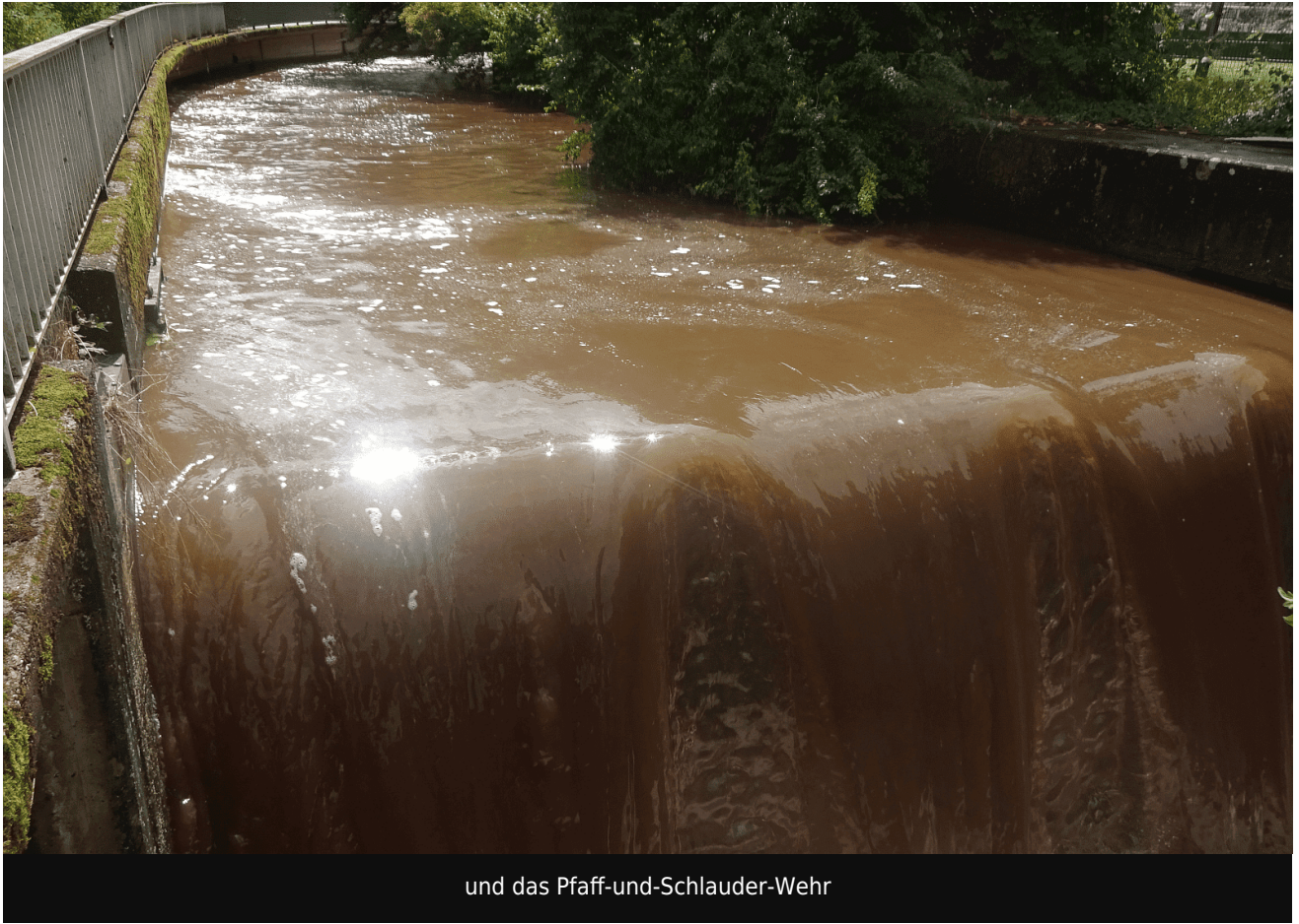
und das Pfaff-und-Schlauder-Wehr