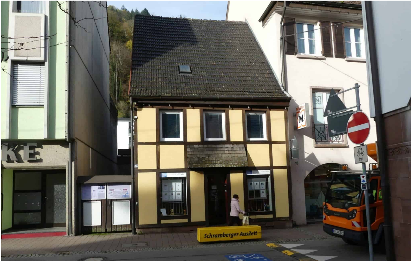
Würde das Häusle abgebrochen, gäbe es einen breiten Durchgang zur Schiltach.