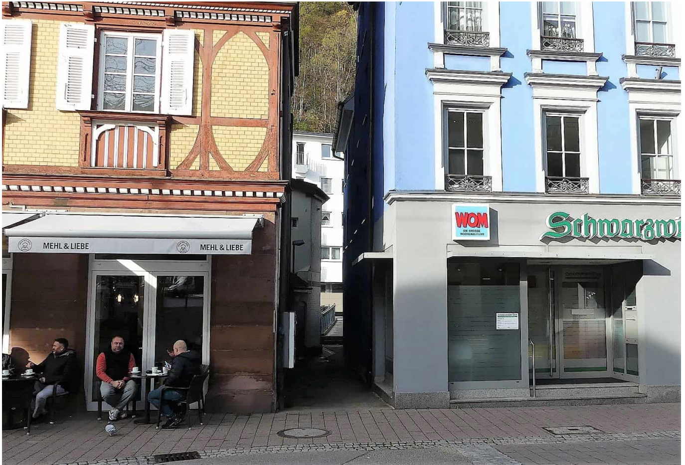
Der Durchgang zwischen Brantner und Schwabo.

Schwarzwälder Boten auszubauen und eine neue Brücke über die Schiltach zu bauen.