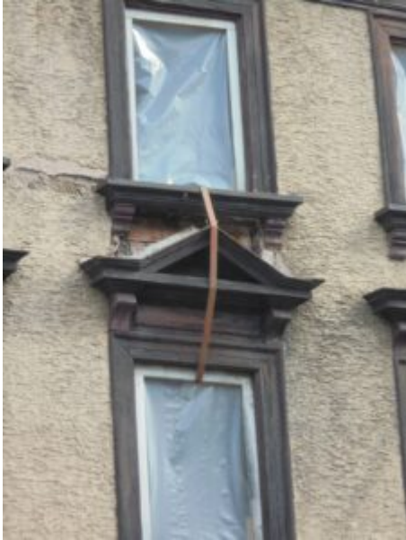
Wenig vertrauenserweckend: Ein Spanngurt sichert ein Fenstersims.

Derzeit versperrt dort allerdings ein Bauzaun den Gehweg und die Parkplätze aus Sicherheitsgründen. Wie berichtet, hatte die Stadt den Bauzaun stellen lassen, weil Teile der Fassade auf den Gehweg gefallen waren. Jetzt müssen die Fußgänger auf die Straße ausweichen.