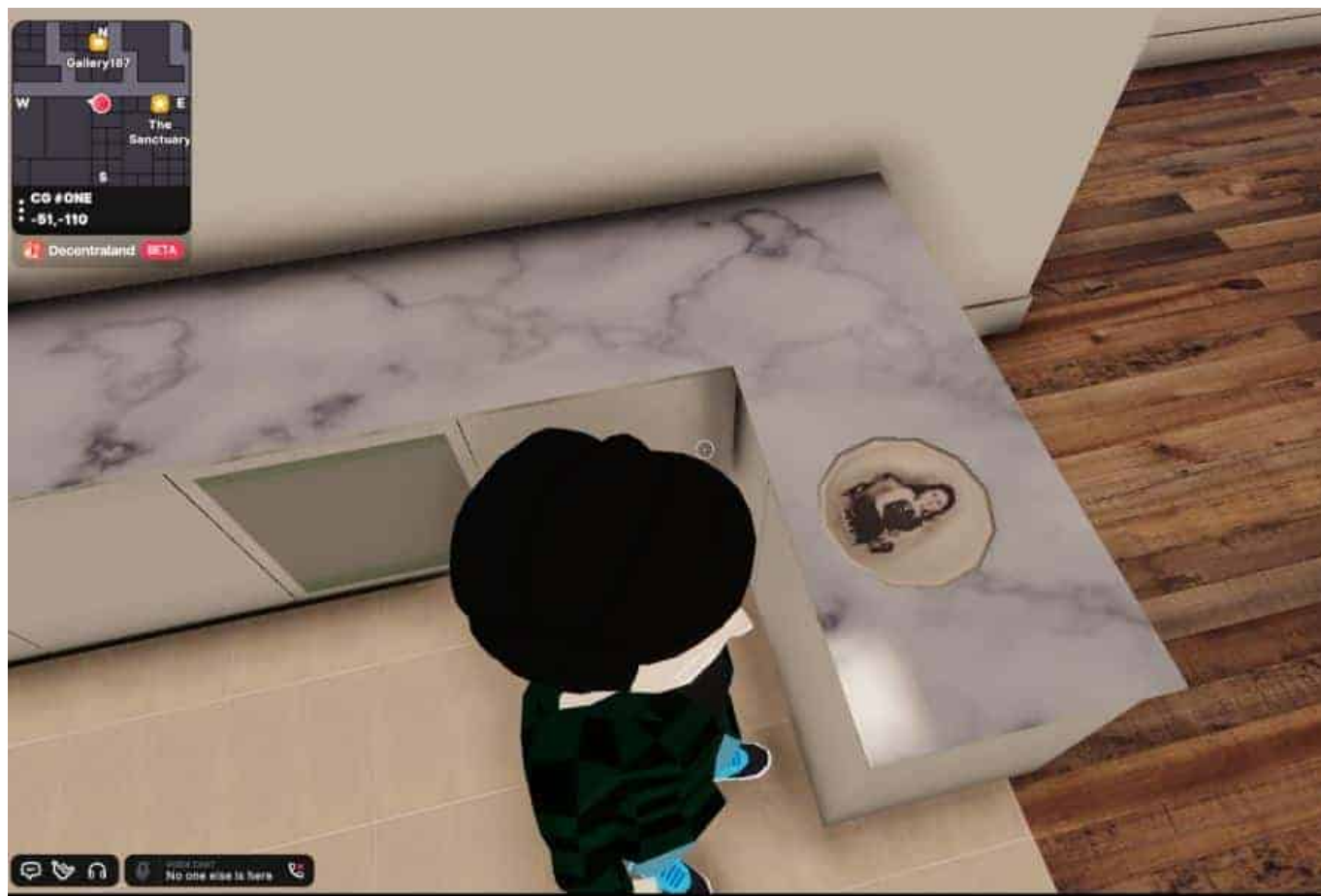
Der Teller in der Küche.