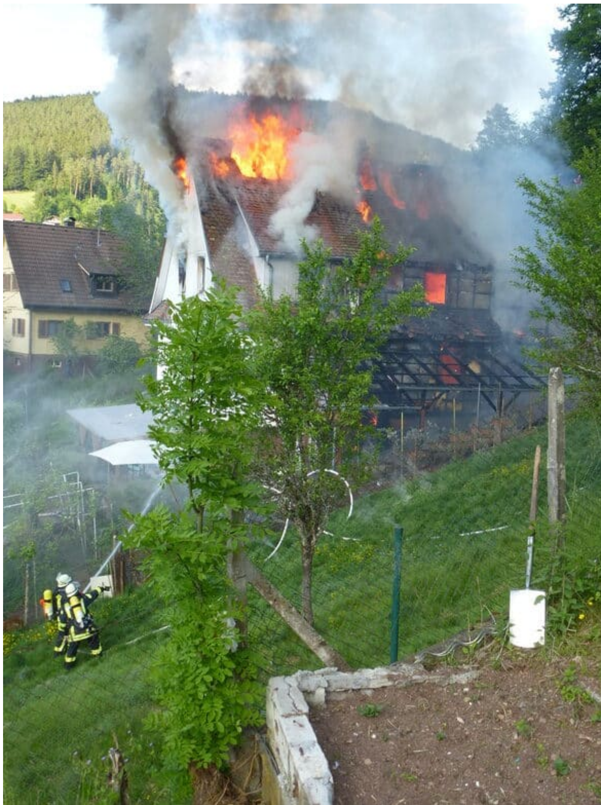
Das Haus brannte lichterloh.

SCHRAMBERG (him) - Noch nicht geklärt ist, wie es am Mittwochabend zum Brand in einem Wohnhaus in der Rausteinstraße kommen konnte. Die NRW hat aus mehreren Quellen erfahren, dass das Haus am