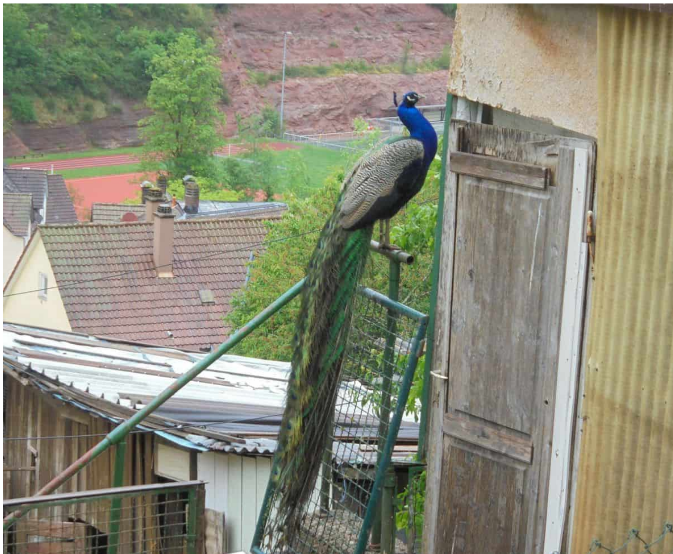
Scheuer Vogel: Pfau auf dem Gelände des abgebrannten Hauses.

Auf dem Grundstück hatte der Hausbewohner zahlreiche Tiere gehalten, die sich teilweise noch immer dort befinden: einige Hühner und Enten, drei Hunde und ein Pfau.