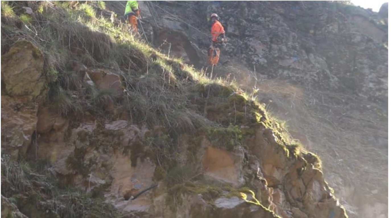
Echter Knochenjob. Video und Fotos: him