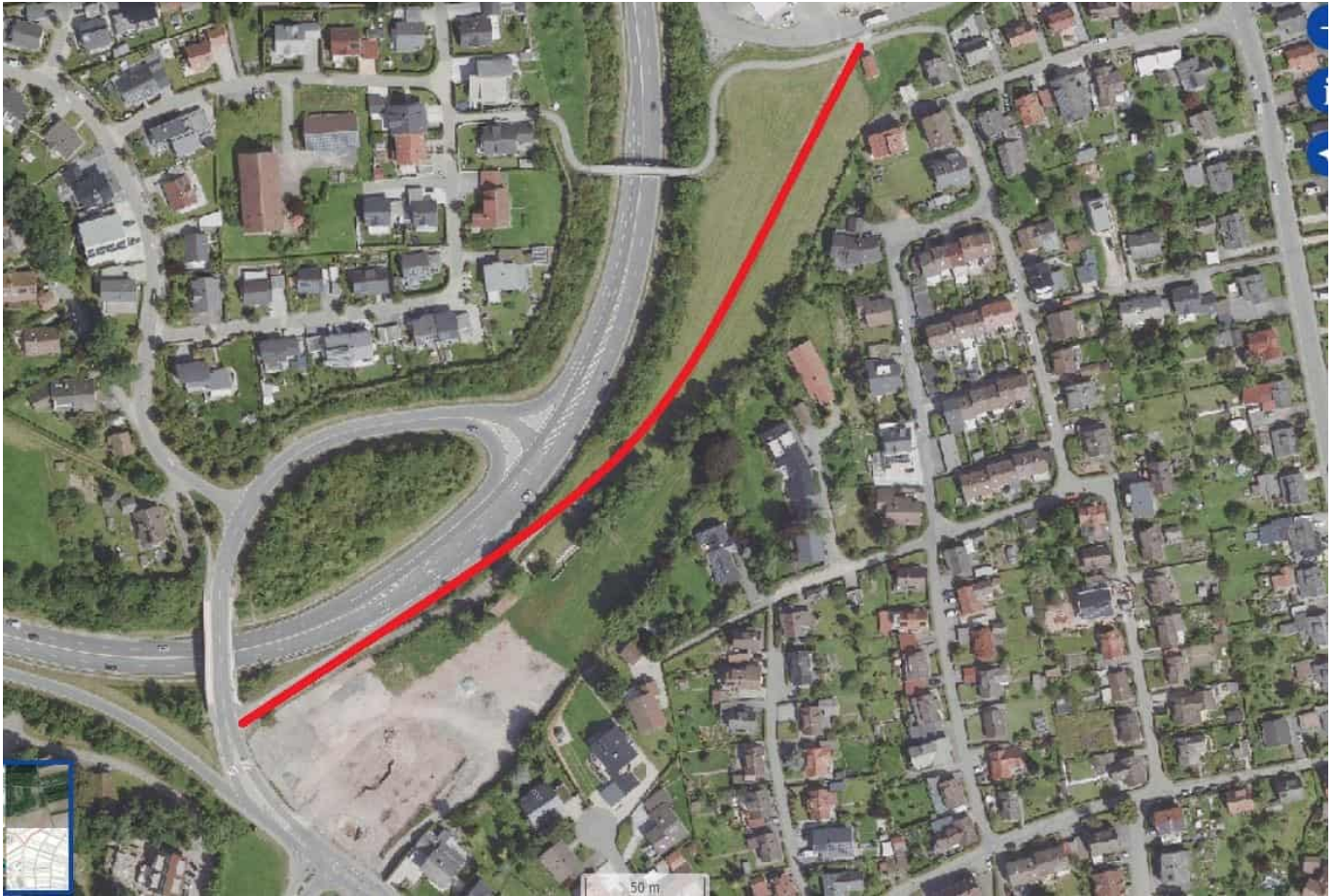
Statt direkt über den Aldiparkplatz würde der Geh- und Radweg am Gelände vorbei zur Schramberger Straße unten links) führen.

Die von der Stadt vorgeschlagene Alternative führe ja am Gelände vorbei auch zum Markteingang: „Der Gehweg an der Schramberger Straße wird verbreitert und schließt an den Wirtschaftsweg an, der ebenfalls im Zuge der weiteren Planung (Bebauungsplanverfahren „Aichhalder Straße“) ausgebaut werden soll“, heißt es dazu in den Anmerkungen.