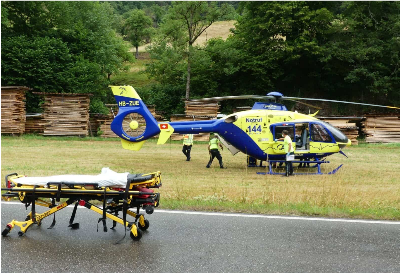
Der Verunglückte wird versorgt. Ein Rettungshubschrauber flog ihn in eine Unfallklinik.

Auf der Bundesstraße B 462 zwischen Schiltach und Hinterlehengericht war offenbar eine größere Gruppe Motorradfahrer Richtung Schramberg unterwegs. Einer der Biker war dann nach links auf die Gegenfahrbahn und weiter in den Straßengraben geraten. Beim Sturz hat er sich schwere Verletzungen zugezogen.