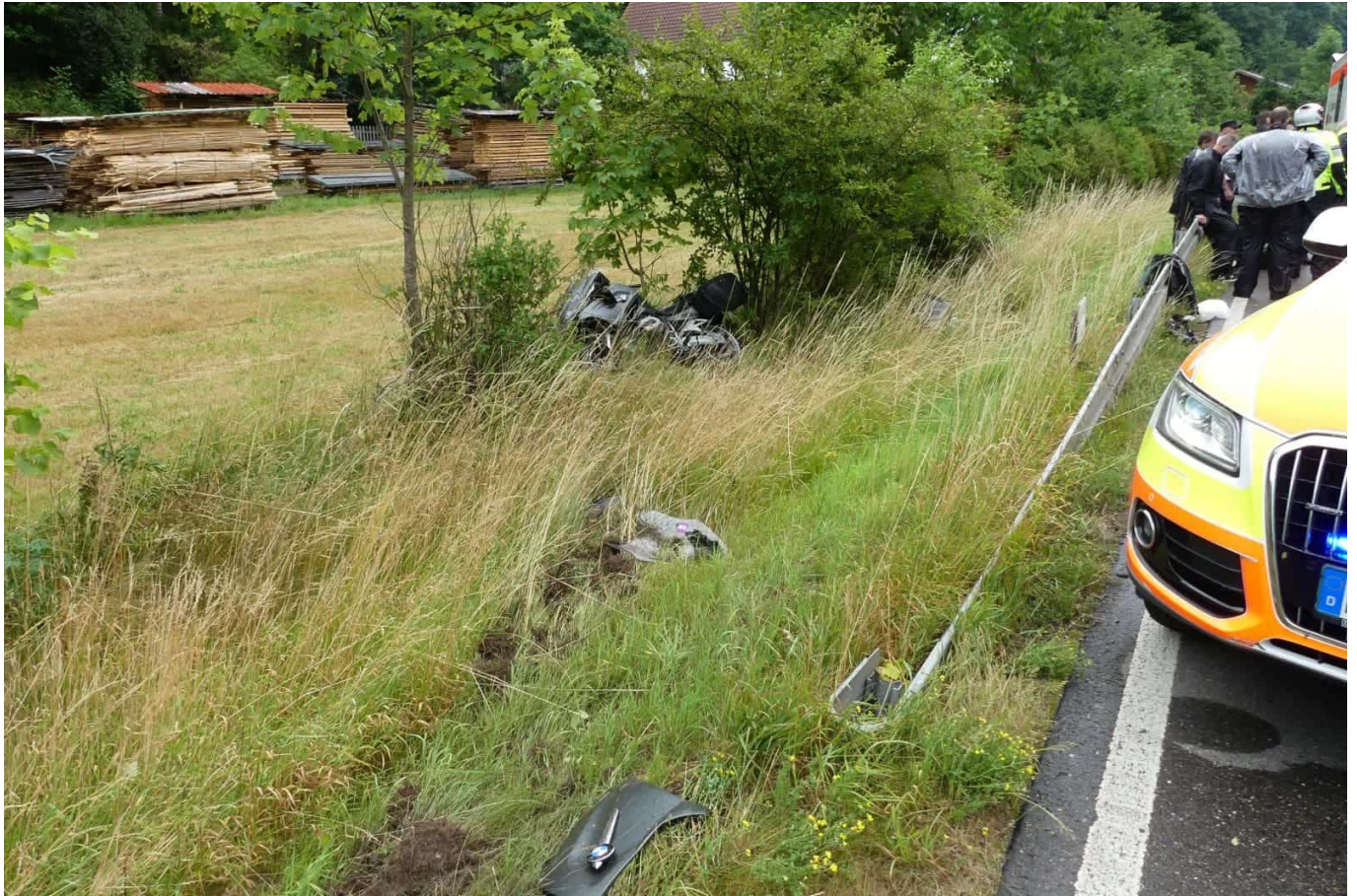
Kurz vor Beginn der Leitplanke war der Biker von der Strecke abgekommen.