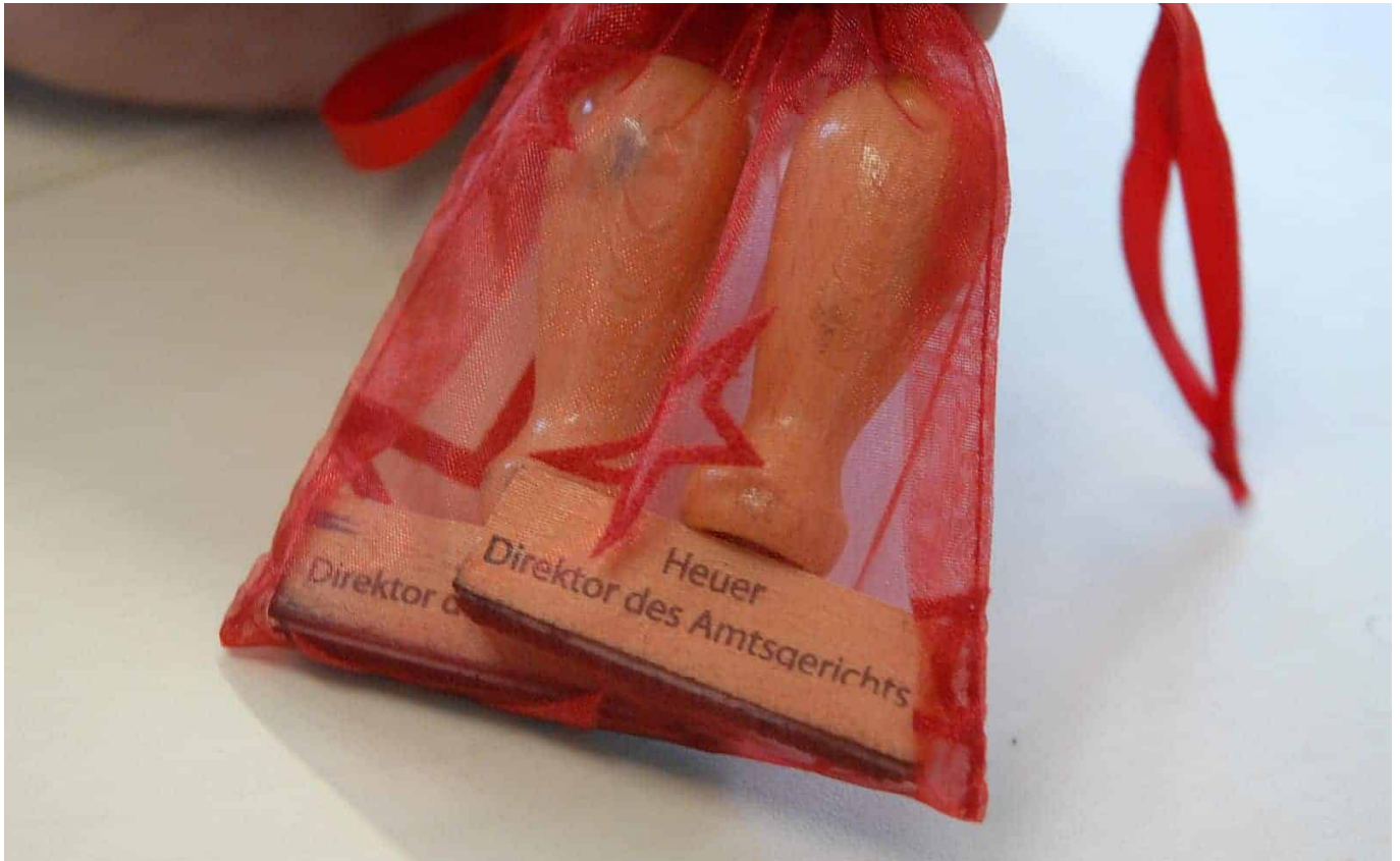
Souvenir aus dem Dienstzimmer.

Ich kann mich eigentlich nur an gute Dinge erinnern. Die Zusammenarbeit war immer offen, ehrlich und reibungslos.