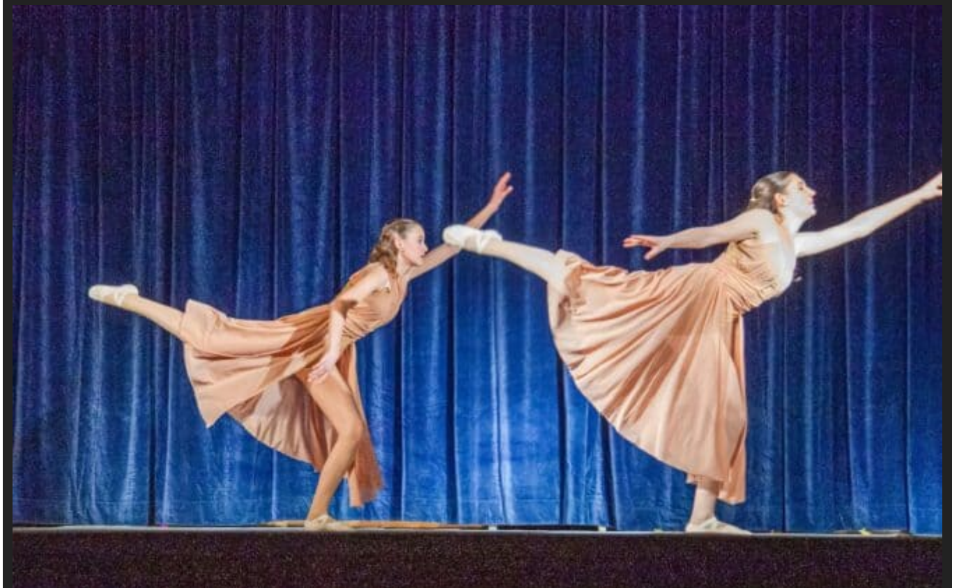
img 7160a 204508