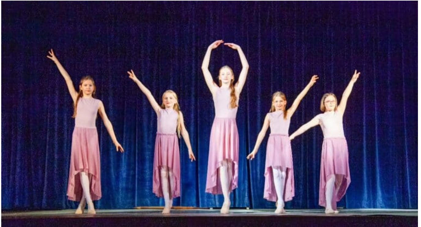
img 7123a 201459