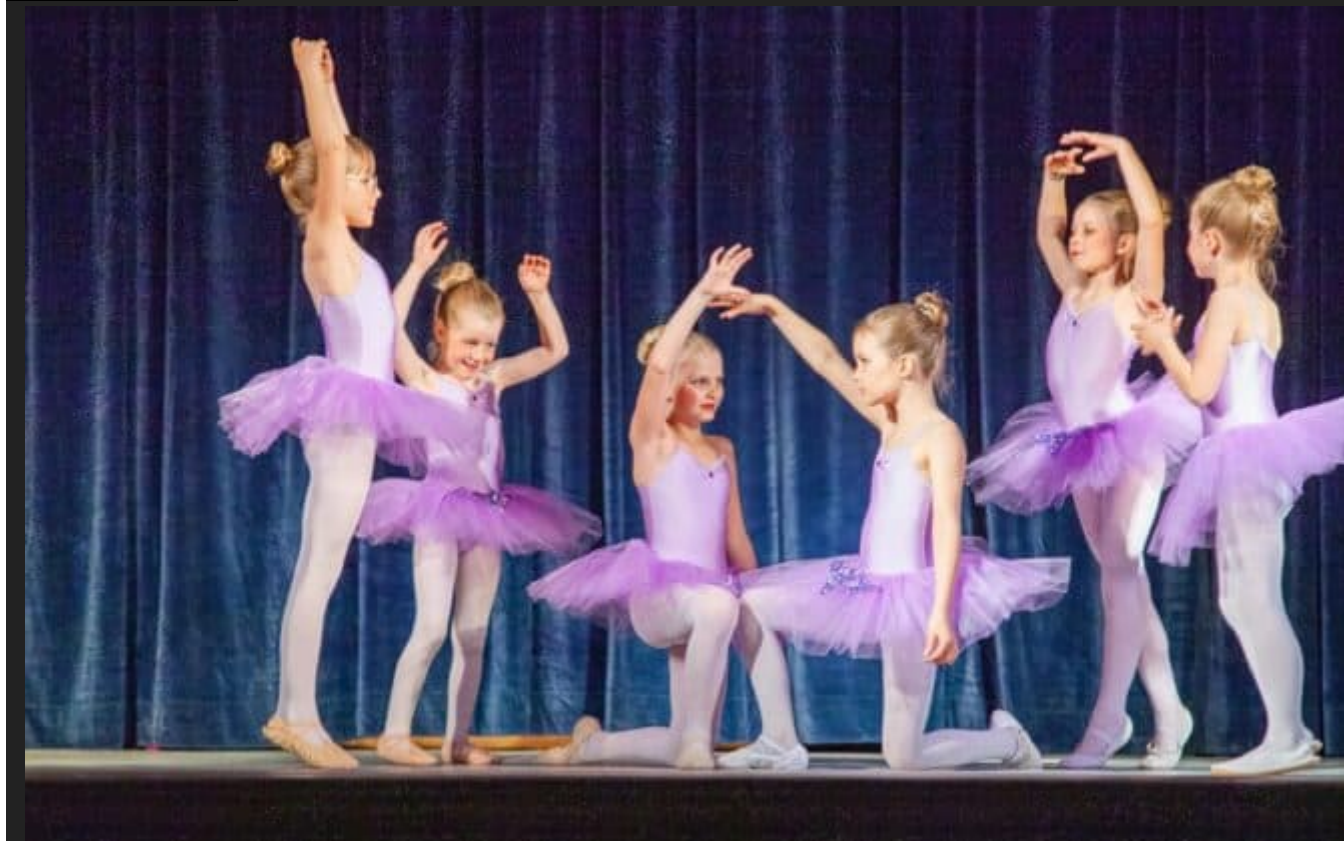
img 7067a 195306