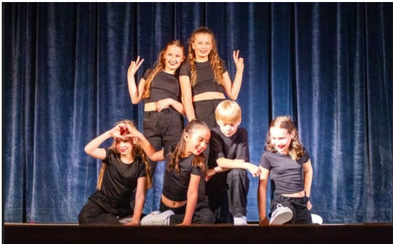
gk8f0021a 212102 denoise