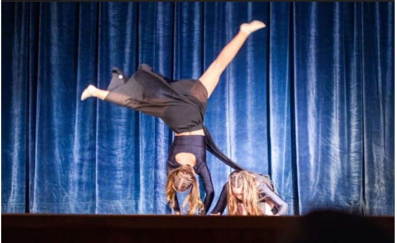
gk8f0446a in pixio 133357