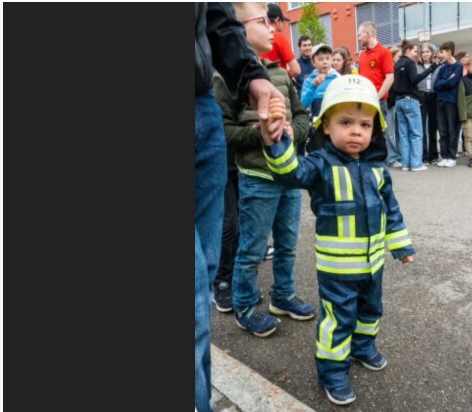
dsc05848 feuerwehr nachwuchs