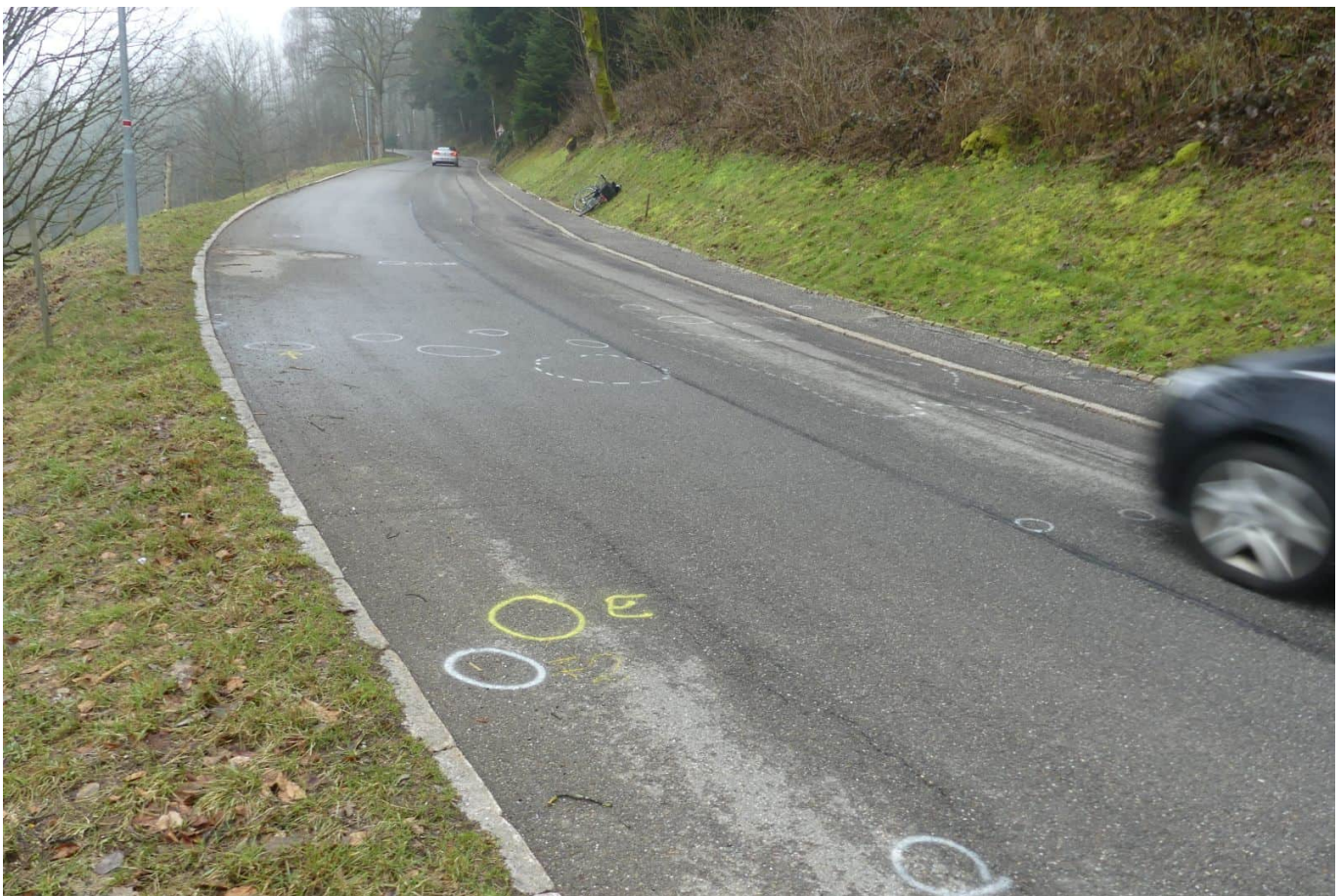
Mehr als 300 Meter wurde das Unfallopfer unter dem Auto liegend mitgeschleift ....

Dem Mann wird vorgeworfen, einen damals 26-jährigen an einem frühen Samstagmorgen an der Steige zwischen der Talstadt und Sulgen überfahren und gut 300 Meter mitgeschleift zu haben.