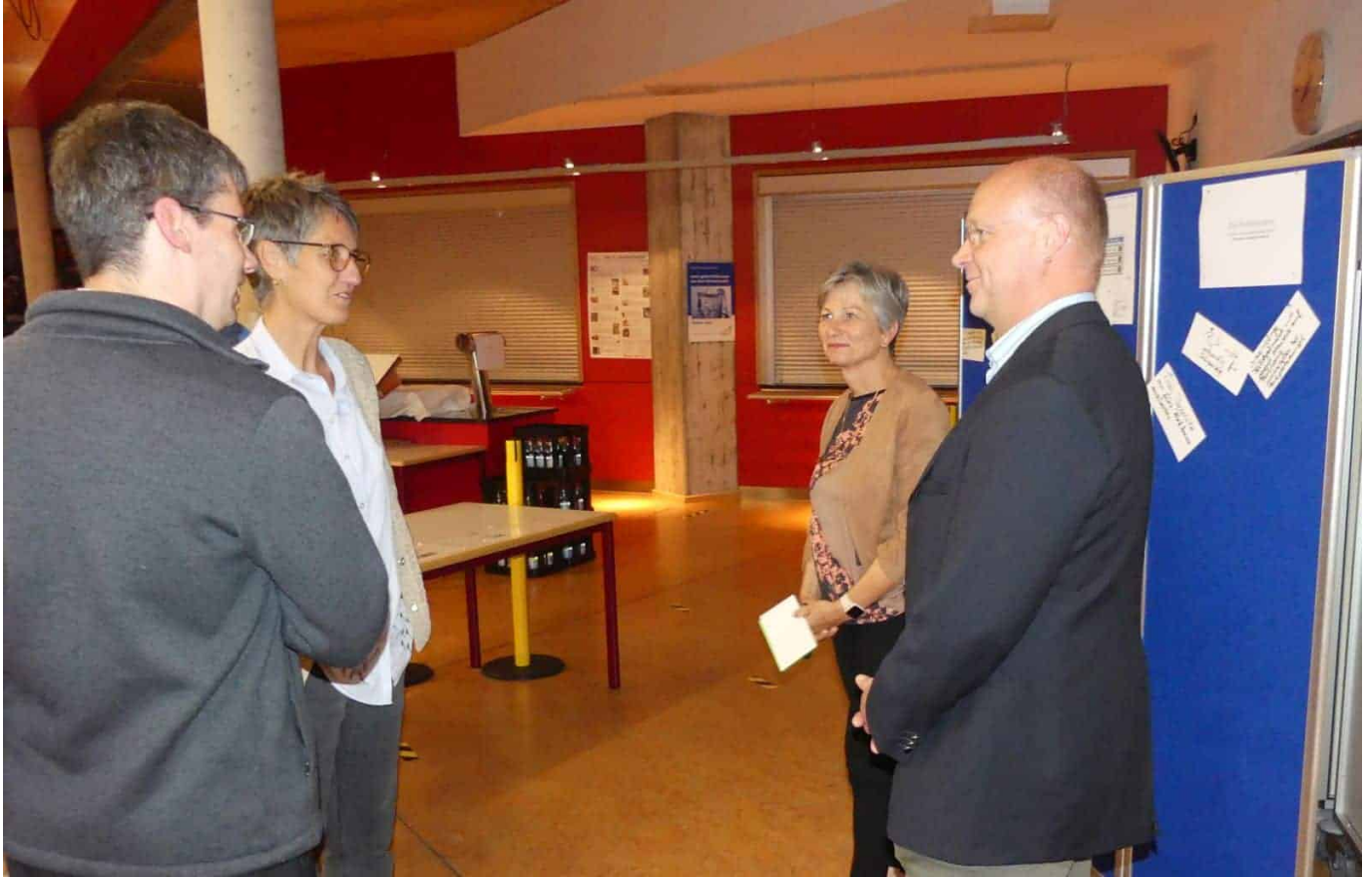
Diskussionen in kleinen Gruppen....