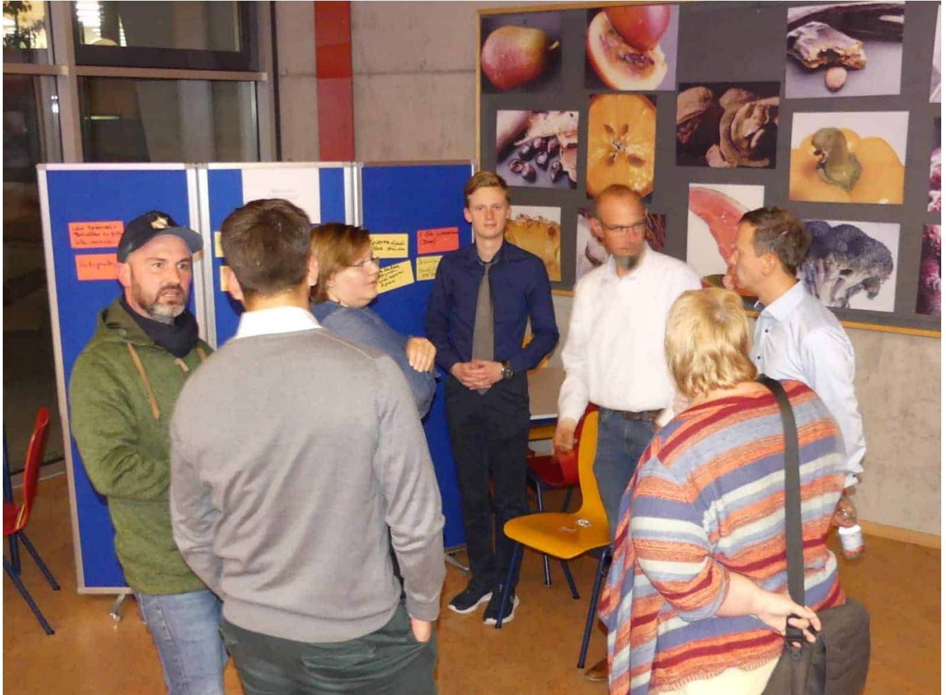
...bringen neue Ideen.

müsse man geeignete Plätze ausweisen. Eine andere Frage war, was passiert mit den Parkplätzen, wenn das autonome Fahren kommt? Angeregt wurde die flexible Nutzung der Fußgängerzone: Im Winter, wenn keine Außengastronomie stattfindet, könne man auch hineinfahren und parken.