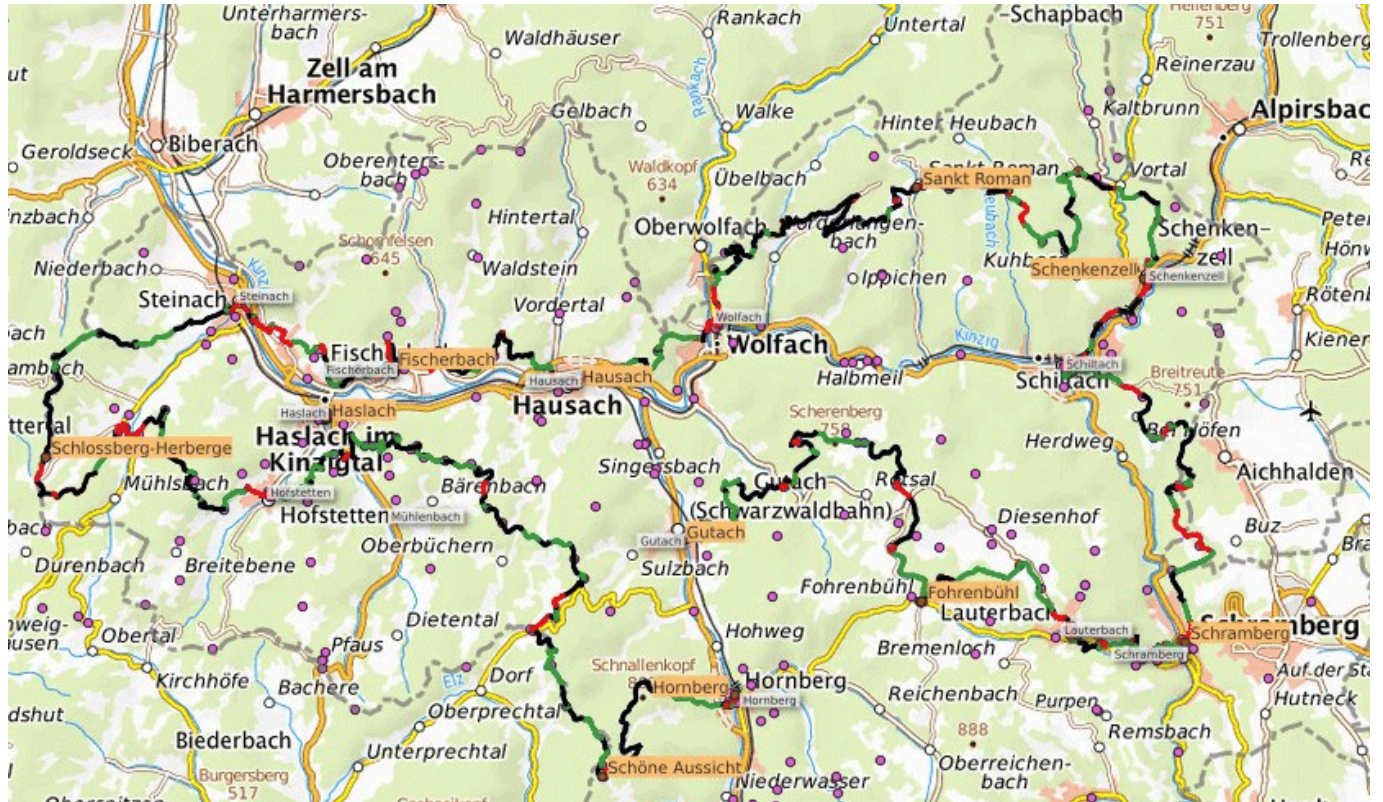
Die geplante Strecke des Kinzigtalwandersteigs. Grafik: pm

Zu 96 Prozent verläuft der Streckenentwurf auf bereits beschilderten Wanderwegen, vier Prozent der Strecke wären neu auszuweisen. Der geplante Mehretappenwanderweg soll auf der gesamten Länge mit einer neuen „Kinzigtal-Raute“ ausgeschildert werden. Ziel dieser Maßnahme ist eine bessere Vernetzung der beteiligten Gemeinden, die Schaffung eines gemeinsamen touristischen Leuchtturmprodukts für die Region und die Lenkung von Wandergästen.